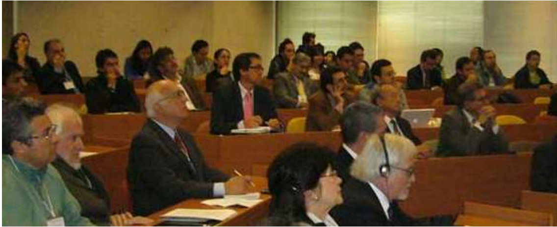
Taller 1 Cambios Climáticos y Retos de Nuevos Escenarios